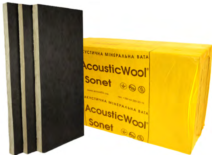
Акустична мінеральна вата AcousticWool® Sonet P

Характеристики акустичної мінеральної вати AcousticWool® Sonet P відповідають вимогам ДБН В.1.1-31:2013 «Захист територій, будинків і споруд від шуму» і ДСТУ Б В.2.7-183:2009 «Будівельні матеріали. Матеріали і вироби будівельні звукопоглинаючі і звукоізоляційні. Класифікація і загальні технічні вимоги». Сертифікат відповідності УкрСЕПРО № UA.BUD.512104-22